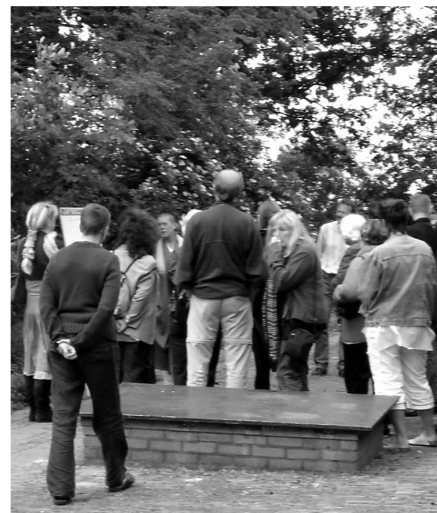
Rondleiding: Jiun roshi verdwenen in de menigte