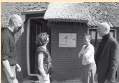
Bestuursleden van de SVNP kijken naar het proefstukje van de rietdekker